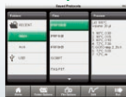
T100プロトコール呼出画面