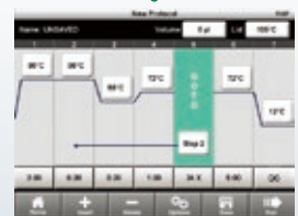
T100プロトコール編集画面